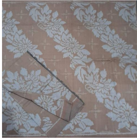
Gambar 8. Wastra Mukti Ginayuh

Gambuh merupakan tahapan ketika manusia menemukan jodohnya. Seri gambuh memiliki judul “Mukti Ginayuh”. Mukti ginayuh memiliki arti tercapainya kesejahteraan yang dalam konteks ini bukan hanya merujuk pada konsep asmara, melainkan tercapainya cita-cita, angan maupun tujuan hidup. Motif yang digunakan dalam judul seri ini adalah stilasi dari pohon buah markisa yang menjulur serta kumbang yang hinggap. Bercerita bahwa kesuksesan mampu diraih ketika manusia mampu memegang prinsip hidupnya sendiri.