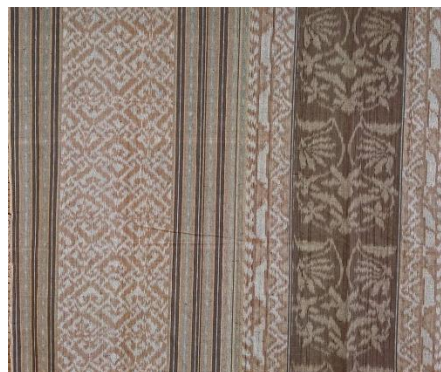
Gambar 9. Wastra Nyadhong Palillah dan Wastra Nyadhong Rejeki

Dalam seri dandang gula terdapat dua judul yaitu “Nyadhong Rejeki” dan “Nyadhong Palillah”. Seri dandang gula digunakan saat selamatan pisah rumah