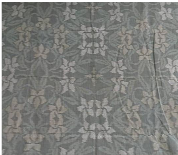
Gambar 7. Wastra Sekar Kinasih

Asmaradana berasal dari kata asmara yang berarti cinta dan dhana/dahana yang memiliki arti api/membara. Asmaradana merepresentasikan perasaan cinta yang menggebu-gebu terhadap pasangan. Pada seri ini, Omah Petrok memberikan judul “Sekar Kinasih”. Sekar Kinasih sendiri memiliki arti bunga terkasih yang diproyeksikan dengan dominasi motif bunga kamboja. Pemilihan motif stilasi bunga kamboja didasarkan pada keelokan warnanya serta aroma yang semerbak wangi mengartikan harapan pasangan yang sedang bercinta-kasih itu mampu menaburkan benih kebahagiaan pada sekelilingnya.