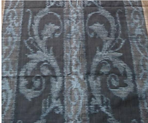
Gambar 11. Wastra Andum Rasa

Andum Trisna bercerita mengenai ketakterbatasan cinta yang mesti dibagi pada seluruh alam semesta. Motif lung melingkar dilambangkan sebagai siklus kehidupan yang melingkar dan kelopak bunga yang mekar sebagai kasih sayang yang mana jika terus dipupuk akan senantiasa menambah keindahan dan kebahagiaan dalam kehidupan.