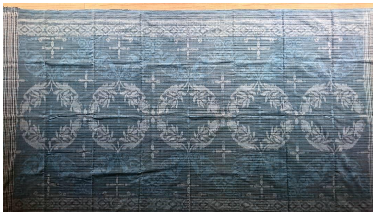
Gambar 2. Wastra Gilang Kahuripan