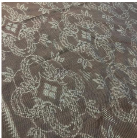
Gambar 13. Wastra Dewi Sri