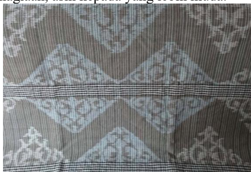
Gambar 10. Wastra Andum Bungah

Seri durma digunakan orang tua pengantin dalam rangka menggelar hajatan pernikahan. Pada seri ini, Omah Petrok membuat tiga judul, yaitu “Andum Bungah”, “Andum Rasa” dan “Andum Trisna”. Andum dalam bahasa Jawa memiliki arti berbagi. Andum Bungah berarti berbagi kebahagiaan yang disimbolkan melalui motif floral empat penjuru yang melambangkan empat arah mata angin (timur, selatan, barat, utara) yang mengingatkan kita untuk menebarkan kebahagiaan ke segala penjuru. Motif ini terinspirasi oleh motif ukiran di masjid Mantingan Jepara. Seri ini menunjukkan bagaimana cara orangtua berbagi rasa, kebahagiaan, asih kepada yang lebih muda.