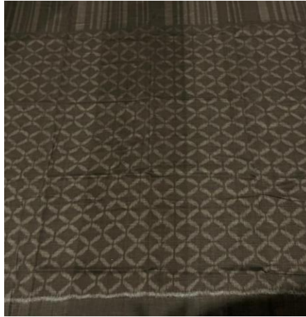
Gambar 14. Wastra Kawung Suwung

Seri Megatruh memiliki arti putusnya ruh. Dalam falsafah Jawa, megatruh merupakan perlambangan akan kematian, pelepasan jiwa sekaligus pengingat akan kefanaan dunia. Judul pada seri ini adalah “Kawung Suwung” yang berarti kekosongan. Menandakan bahwa kehidupan ini sudah selesai. Pada seri ini, Omah Petrok hanya menggunakan dua motif, yaitu kawung dan garis. Dalam konteks ini, motif tersebut menunjukkan makna bahwa kehidupan sudah selesai dan yang tersisa hanyalah kehampaan dan kekosongan. Wastra ini ditujukan sebagai penghiburan untuk keluarga.