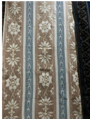
Gambar 15. Wastra Svargi Langgeng