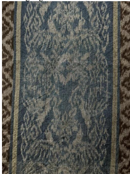
Gambar 6. Wastra Gondo Arum

Sinom merupakan tahapan dimana manusia berusia muda secara emosional dan pemikiran. Pada tahap ini, manusia cenderung memiliki semangat dan harapan yang besar untuk belajar dan mengeksplor hal baru. Pada seri ini, Omah Petrok memberikan nama judul “Gondo Arum”. Gondo arum secara harfiah berarti wangi harum. Dalam usia beranjak dewasa, manusia akan berada di masa kejayaannya atau golden age . Pada saat ini, manusia akan cenderung segar dan harum.