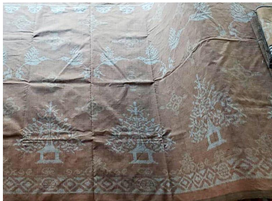
Gambar 3. Wastra Raden Selamat

Seri mijil merupakan tahapan kehidupan dimana seseorang yang sudah ditiupkan ruhnya didalam kandungan dilahirkan ke dunia. Fase ini digambarkan sebagai fase dimana manusia mulai mengenal kehidupan dunia dengan segala dinamikanya untuk beradaptasi dan memulai kehidupan yang baru setelah dari alam ruh. Seri ini memiliki dua judul yaitu, “Raden Selamat” dan “Sri Rahayu”.