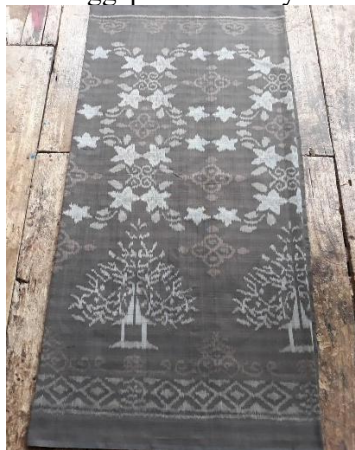
Gambar 4. Wastra Sri Rahayu

Pada seri ini, Omah Petrok menggunakan motif tumpal kayon atau gunungan yang dalam mitologi Jawa berarti alam semesta atau jagad atau kosmos. Motif tumpal dalam seri ini digunakan sebagai penanda kelahiran manusia yang masih putih dan bersih belum terkena norma dan hitam-pelik kehidupan di dunia seperti kertas putih yang belum digoreskan tinta hitam. Omah Petrok menggunakan wastra ini sebagai bagian dari budaya simbolik dalam kelahiran. Dalam penggunaannya, kain Raden Selamat digunakan ketika bayi yang lahir berjenis kelamin laki-laki dan kain Sri Rahayu untuk bayi perempuan. Pada kain judul Raden Slamet, Omah petrok juga menggunakan motif burung dan bintang yang merujuk ke fase sebelumnya. Burung berarti simbol kebebasan jiwa manusia sebagai doa dan harapan agar si bayi dapat bebas terbang kesana kemari untuk menggapai cita-citanya.