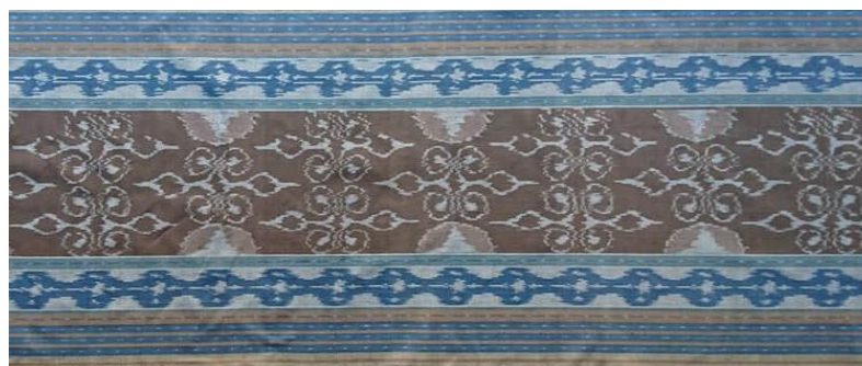
Gambar 5. Wastra Trinil

Kata kinanti berasal dari kata kanthi yang dalam bahasa Jawa memiliki arti bersama, tuntunan atau gandengan tangan. Pada masa ini merupakan tahapan ketika manusia mulai tumbuh dan berkembang mengenal hal-hal baru. Pada seri ini, Omah Petrok memberi nama judul “Trinil” yang merupakan nama kecil R.A Kartini yang merepresentasikan bahwa perempuan itu tidak terbatas oleh apapun, bebas, dan leluasa