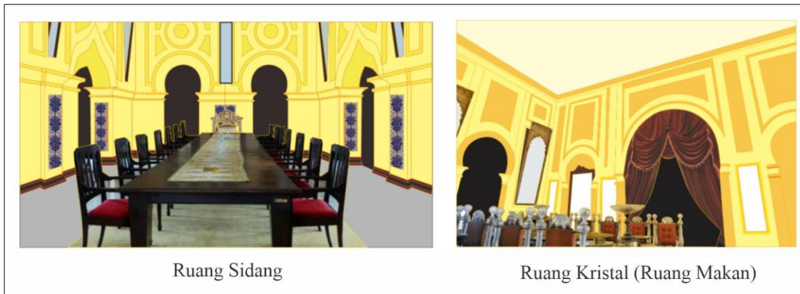
Gambar 3 Fungsi Zona Semi-Publik/Semi-Privat

Zona semi-publik atau semi-privat di Istana Asserayah Al Hasyimiah terutama diwujudkan melalui Ruang Kristal (ruang makan kerajaan) dan Ruang Sidang yang terletak di lantai dasar istana. Secara fungsional, kedua ruang ini menjadi perantara antara area publik yang terbuka bagi khalayak luas dan zona privat yang hanya diperuntukkan bagi keluarga sultan, sehingga pola penggunaannya diatur dengan ketat melalui protokol istana dan tata krama tradisional Melayu. Pengaturan ini menjadikan zona semi-publik sebagai lapisan penyangga yang menjaga martabat, hierarki, dan keamanan simbolik di dalam struktur sosial kesultanan.