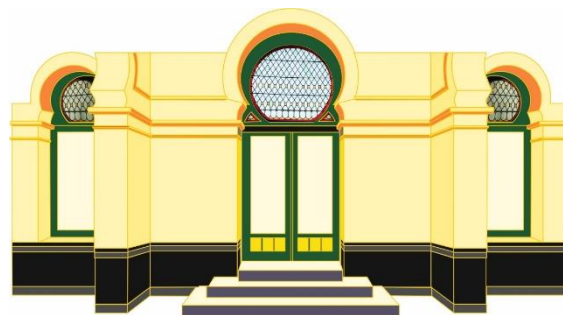
Gambar 1 pintu utama istana

Selain itu, lahan istana yang luas dengan penanaman pohon dalam jumlah cukup memberikan suasana lapang dan nyaman. Pencahayaan alami yang masuk ke dalam ruangan menghadirkan kesan terang sekaligus menyegarkan. Sebelum menelaah fungsi ruang secara lebih detail, penting untuk memperhatikan pintu utama istana.