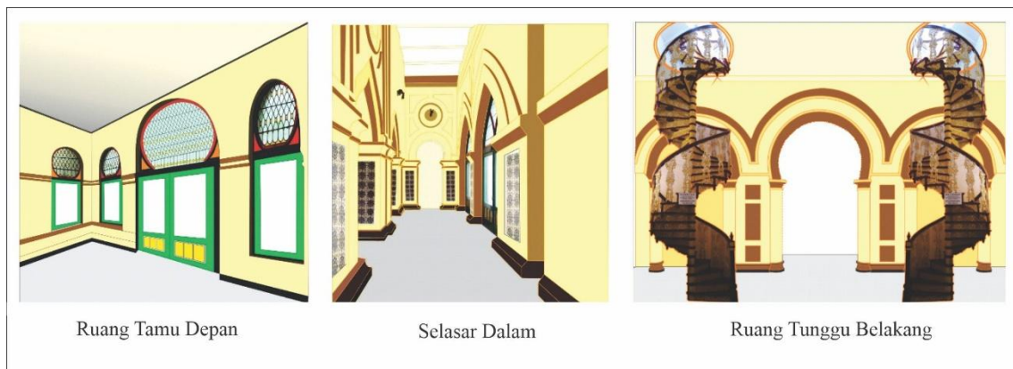
Gambar 2 Fungsi Zona Publik Dokumentasi Digital Pribadi. 2025.

Zona publik Istana Asserayah Al Hasyimiah mencakup ruang tamu depan, ruang tunggu belakang, dan selasar dalam yang menjadi wajah utama istana sekaligus ruang interaksi sosial pertama antara istana dan masyarakat. Zona ini dirancang sebagai area yang mudah diakses dari arah depan maupun belakang bangunan, sehingga mengalirkan sirkulasi tamu secara lancar dan teratur sebelum memasuki ruang-ruang dengan tingkat privasi yang lebih tinggi. Ruang tamu depan berfungsi sebagai tempat penerimaan awal, tempat tamu menunggu, sekaligus ruang representasi yang menampilkan kewibawaan, kemegahan, dan citra kesultanan melalui tata ruang, warna, ornamen, dan perabot yang dipilih dengan cermat sebagai wujud karya seni budaya yang hidup.