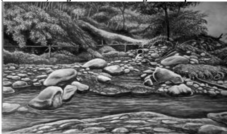
Gambar 6. Patimuan Sungai Cimeta dan Sungai Cikalapa

Karya rupa yang kedua berjudul “ Patimuan Cimeta – Cikalapa ”, berdimensi / berukuran 27 cm x 37 cm, memakai medium pensil grafit, drawing pen ( Micron ), Tinta Cina, dan Tinta Putih ( Winsor ), dengan menggunakan art paper ( Premium Canson ), serta dibuat pada bulan Agustus 2024. Di lahan ISBI Cikamuning ini terdapat pertemuan dua sungai, Patimuan berasal dari bahasa Sunda yang berarti Pertemuan, jadi karya rupa ini merupakan replikasi secara dokumentatif dari bertemunya dua sungai, yaitu sungai Ci Meta dan sungai Ci Kalapa .