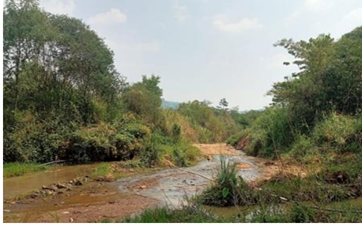
Gambar 2. Foto Pepohonan dan Alur Sungai Cikalapa ISBI Cikamuning

Panorama alam yang digambarkan menjadi media refleksi mengenai hubungan seni dan ekologi, serta memperkuat harapan identitas ISBI sebagai institusi seni yang tumbuh dalam harmoni dengan lingkungan alamnya. Dengan demikian, ilustrasi berperan sebagai jembatan antara dokumentasi visual, ekspresi kreatif, dan penyampaian pesan ekologis.