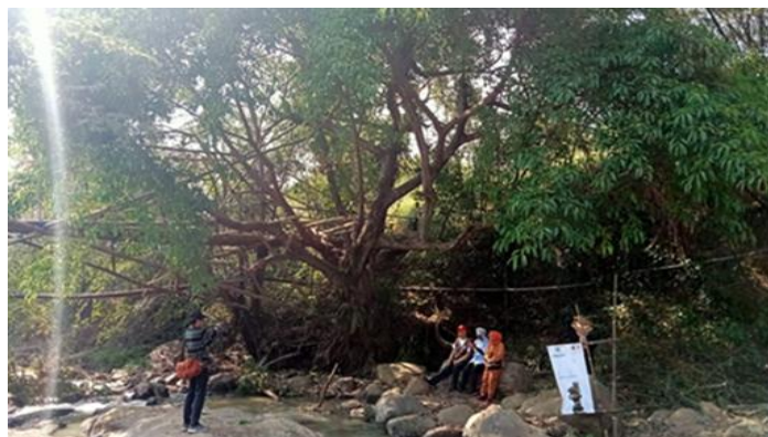
Gambar 1. Foto Pohon Bunut dan Sungai Cimeta ISBI Cikamuning