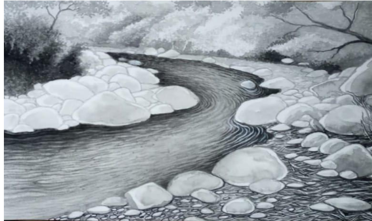
Gambar 3. Gambar Sketsa Bebatuan dan Pepohonan di Sungai Cimeta

Hasil eksplorasi ini kemudian menjadi dasar untuk merancang komposisi ilustrasi panorama alam ISBI Cikamuning, dengan tujuan tidak hanya merekam keindahan lanskap, tetapi juga menghadirkan nuansa estetis yang merefleksikan suasana tenang, alami, dan inspiratif dari lingkungan kampus tersebut. Untuk melangkah dan memahami gambar ilustrasi, penulis termotivasi oleh seorang ilustrator ulung yang telah malang melintang di jagad ilustrasi Indonesia yang sering menggambar suasana alam, hal ini diperlukan sebagai pengetahuan dan pembelajaran.