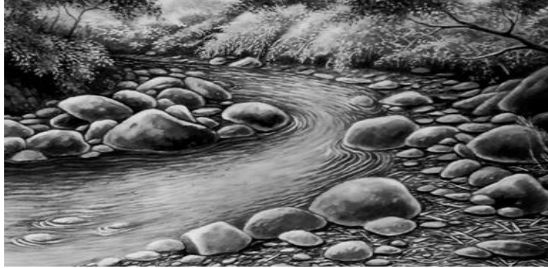
Gambar 7. Liukan Sungai Cimeta (Sumber : A.K Patra Suwanda, 2024)

Karya ketiga berjudul “ Liukan Sungai Cimeta ”, berdimensi/berukuran 27 cm x 37 cm, memakai medium pensil grafit, drawing pen (Micron) , Tinta Cina, dan Tinta Putih ( Winsor ), dengan menggunakan art paper (Premium Canson) , serta dibuat pada bulan Agustus 2024.