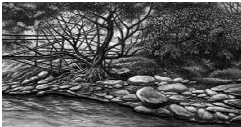
Gambar 5. Pohon Ki Bunut di Sungai Cimeta (Sumber : A.K Patra Suwanda, 2024)

Karya rupa pertama berjudul “ Pohon Ki Bunut di Sungai Cimeta ”, berdimensi/berukuran 27 cm x 37 cm, memakai medium pensil grafit, drawing pen