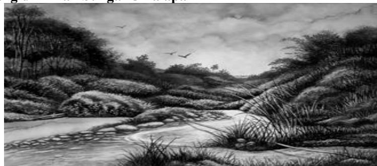
Gambar 8. Alang-alang di Aliran Sungai Cikalapa

Karya keempat berjudul “ Alang-alang di Aliran Sungai Cikalapa ”, berdimensi/berukuran 27 cm x 37 cm, memakai medium pensil grafit, drawing pen