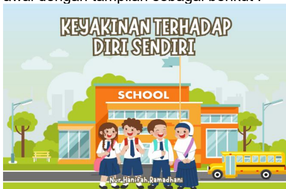
Tampilan Sampul Depan

Berdasarkan proses pengembangan tersebut maka didapatkan hasil produk awal dengan tampilan sebagai berikut :