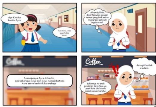
(a) Sebelum Revisi