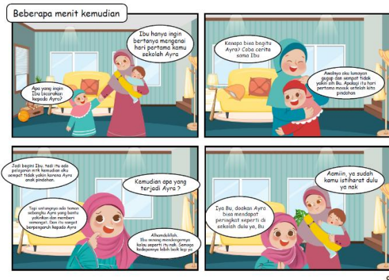
(a) Sebelum Revisi