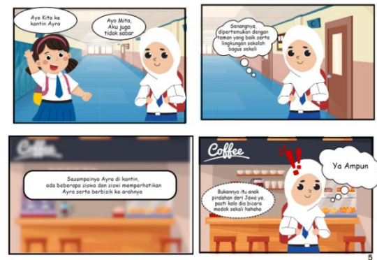
(b) Setelah Revisi