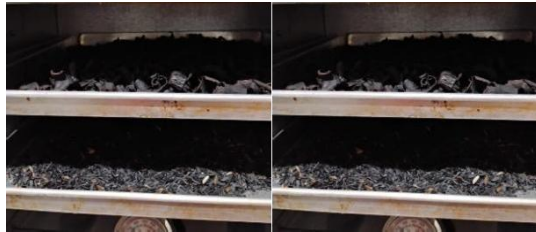
Gambar 1. Pengaktifan Karbon Secara Fisika