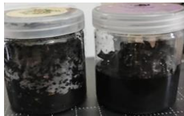
Gambar 2. Pengaktifan Karbon Secara Kimia

Pada langkah ini, karbon yang telah diaktifkan dengan cara fisika kemudian ditempatkan dalam sebuah toples untuk direndam dalam campuran air dan larutan asam asetat ( \text{CH}_3\text{COOH} ) 2,5%. Asam asetat yang dipakai adalah tipe cuka makanan. Proses ini berlangsung selama tiga hari seperti yang ditunjukkan di Gambar 2.