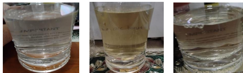
Gambar 3.2. Filtrat Air Bilasan Cucian Karbon Sekam Padi, Kulit Singkong, dan Kombinasinya (dari kiri ke kanan)

Berdasarkan data diatas, dapat dilihat bahwa semua perlakuan filtrasi