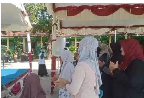
Gambar 2. Pelaksanaan Ice breaking

Sebagai upaya untuk mencegah atau mengatasi permasalahan bullying maka diadakanlah seminar parenting kepada wali atau orang tua siswa untuk menanggulangi fenomena tersebut. Sebelum materi disampaikan, pemateri memberikan ice breaking . Ice breaking merupakan hal yang penting agar peserta bersemangat mengikuti penyuluhan (Azzahra et al., 2023). Proses ice breaking dapat dilihat pada Gambar 2.