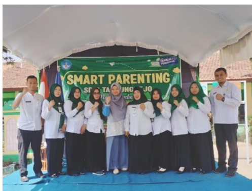
Gambar 4. Foto Bersama