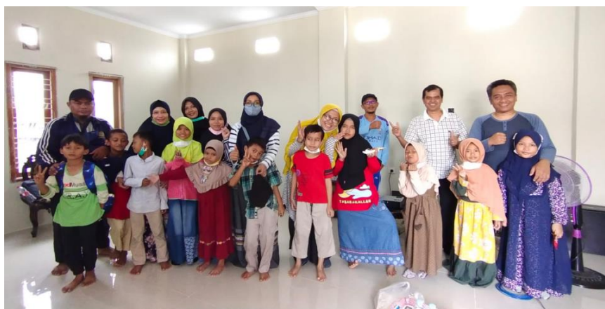
Gambar 4. Foto bersama setelah kegiatan

Setelah pelatihan selesai banyak peserta pelatihan yang menanyakan kelanjutan pelatihan koding. Ini menunjukkan ketertarikan pada koding. Dengan kegiatan pengabdian pada masyarakat untuk komunitas HEbAT ini maka dirasakan kebermanfaatannya kegiatan ini dengan tujuan dibentuknya komunitas HEbAT, yaitu membantu anak-anak komunitas HEbAT menemukan bakat atau talentanya.