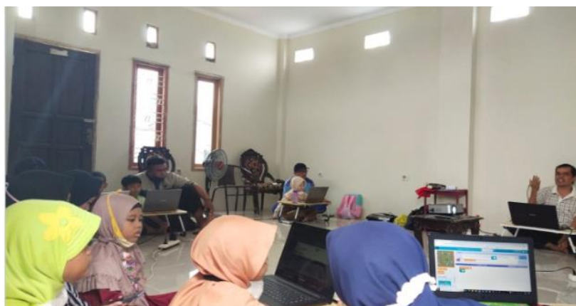
Gambar 2. Peserta mengerjakan proyek koding di platform code.org

Pada tahap kedua peserta diajarkan langkah demi langkah dalam membuat akun di platform code.org dan dilanjutkan dengan menunjukan salah satu proyek yang akan dibuat dan cara penyelesaian proyek tersebut.