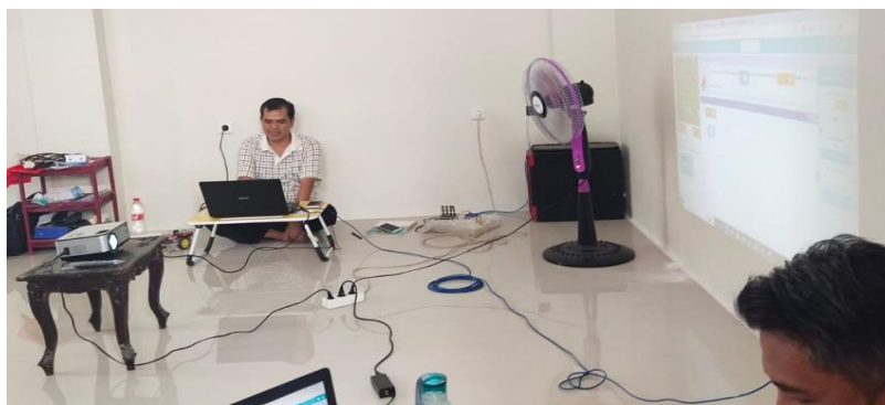
Gambar 1. Pemateri menjelaskan dan mencotohkan pembuatan koding

Pada tahap kedua peserta diajarkan langkah demi langkah dalam membuat akun di platform code.org dan dilanjutkan dengan menunjukan salah satu proyek yang akan dibuat dan cara penyelesaian proyek tersebut.