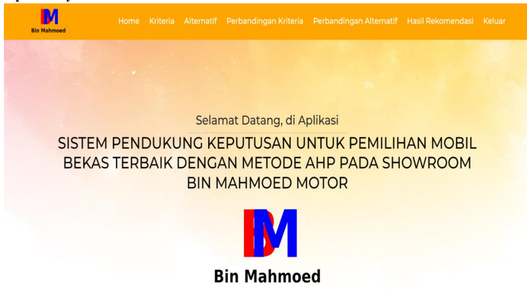
Gambar 5. Tampilan layar utama

Halaman utama menampilkan pesan selamat datang dan navbar dengan menu: Home, Kriteria, Alternatif, Perbandingan Kriteria, Perbandingan Alternatif, Hasil Rekomendasi, dan Keluar.