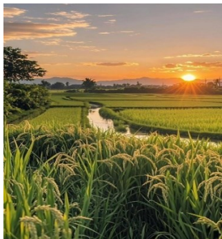
Gambar 2 pemandangan sore di sebuah desa