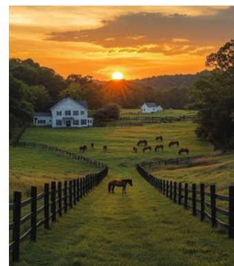
Gambar 5 pemandangan pagi di sebuah ladang