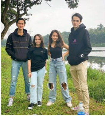
Gambar 7 orang sedang berfoto di pinggir danau