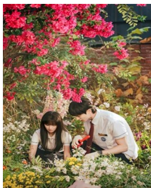
Gambar 5 dua orang siswa sedang berkebun