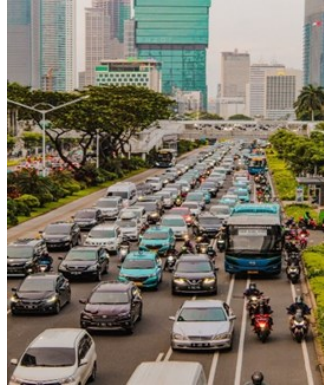
Gambar 8 kemacetan di sebuah kota