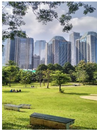
Gambar 10 gedung-gedung tinggi di sebuah kota