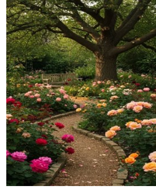
Gambar 9 taman bunga yang indah