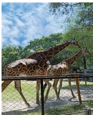
Gambar 4 dua ekor jerapah di kebun binatang