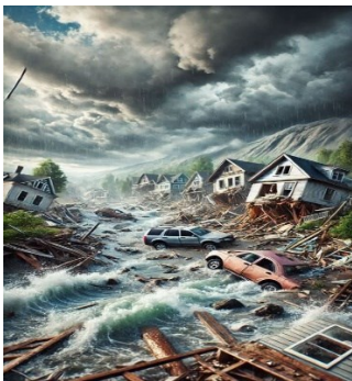
Gambar 1 Bencana alam tsunami

Peneliti menggunakan sebuah gambar sebagai teknik pancing untuk menarik perhatian siswa sekaligus mengaktifkan pengetahuan awal mereka sebelum memasuki materi inti. Visual yang dipilih disesuaikan dengan topik pembelajaran agar dapat membangun rasa ingin tahu serta mendorong siswa memberikan respons awal. Melalui kegiatan ini, peneliti mengajak siswa mengamati, mengajukan pertanyaan, dan menyampaikan dugaan berdasarkan apa yang mereka lihat. Pendekatan tersebut dimaksudkan untuk menciptakan suasana belajar yang lebih hidup, meningkatkan keterlibatan siswa, serta membantu mereka mengaitkan pengalaman sebelumnya dengan konsep yang akan dipelajari.