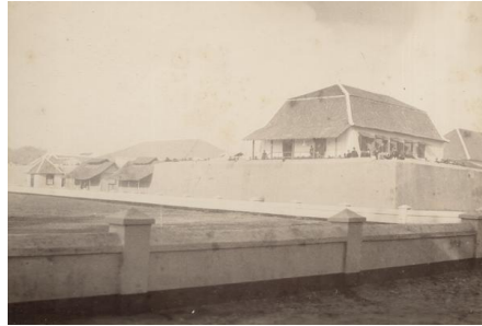
Gambar 3. Salah satu bastion di Benteng Vredenburg

untuk respons cepat, perumahan perwira dan rumah residen berada lebih terlindung di bagian dalam, gudang logistik dan mesiu dipisahkan dari wilayah hunian guna meminimalkan risiko ledakan serta gedung-gedung pelayanan seperti rumah sakit tentara dan ruang administrasi.