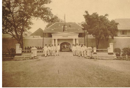
Gambar 1. Benteng Vredenburg pada abad ke 19