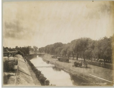
Gambar 2. Parit Benteng Vredeburg

(Sari & Wisdianti, 2024). Dengan adanya sistem ventilasi ini, kelembaban di dalam ruangan juga dapat dikurangi, sehingga kondisi ruang menjadi lebih nyaman dan tidak pengap.